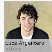
Luca Argentero attore