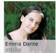
Emma Dante attrice